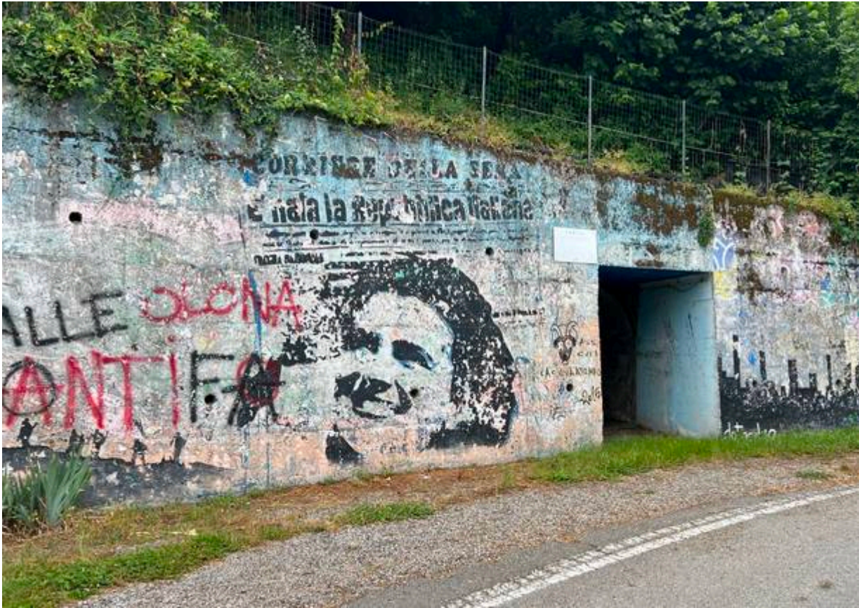
L'accesso esterno al bunker di Marnate