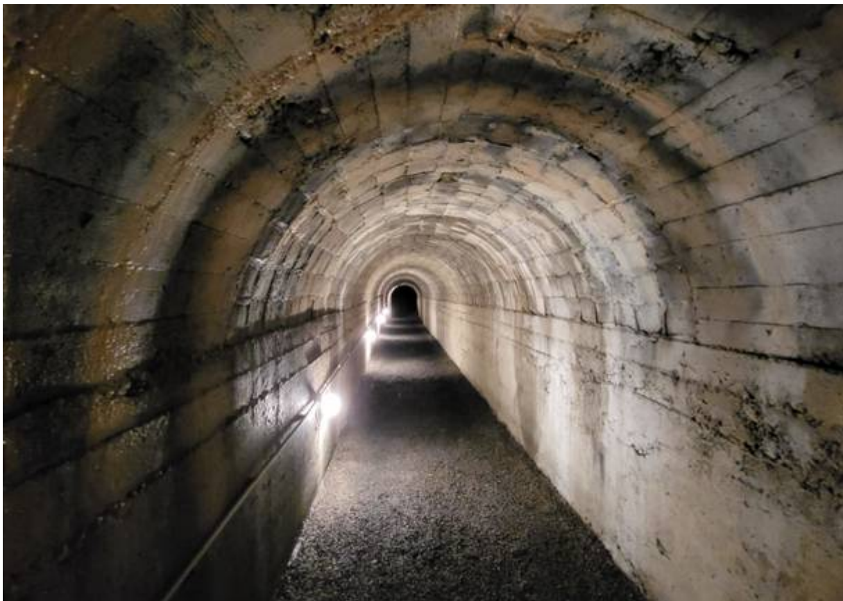
L'interno del bunker

Tante ipotesi che potrebbero appassionare gli amanti della storia e incuriosire anche qualche studente che, oltre a imparare date e nozioni sui libri del liceo, potrà ricordare come la storia sia passata anche da qui e le tracce storiche disseminate sul territorio non fanno che testimoniare.