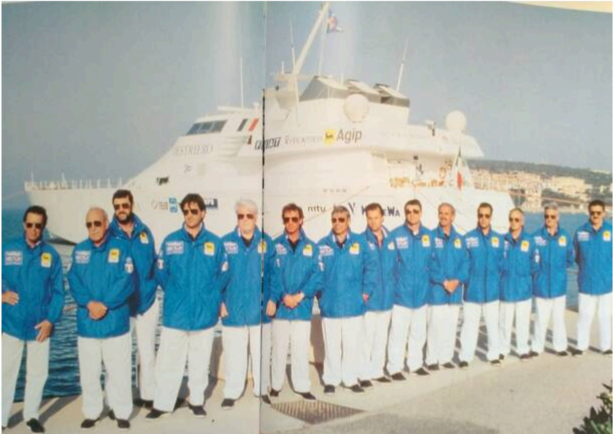
L'equipaggio del Destriero nel 1991

Fu in una di queste occasioni che Federici conobbe Fiorio, che lo volle a bordo del Destriero con lui. «Mi imbarcai come motorista e potei prendere parte a questa avventura incredibile. Eravamo così immersi nella sfida, pronti a lavorare per velocizzare la nostra traversata atlantica, da vivere tutto con gioia, ma forse non pienamente consapevoli della grandezza della nostra impresa, ancora imbattuta tra l'altro – aggiunge con una nota di orgoglio – festeggiammo, entusiasti, all'arrivo, e fummo poi ricevuti anche dal Presidente della Repubblica per un riconoscimento, ma è solo negli ultimi anni che ho risentito la grandiosità di questa esperienza per la mia vita, quando ho iniziato a scriverne».