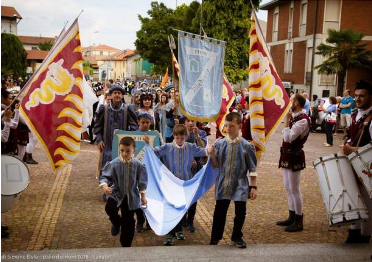
di Simone Elvio - palio dei rioni 2016 - cairate

San Pedar, Maddalena, Grimel, Maduneta, Munasteri e Quadra: sono questi i rioni cairatesi che si contendono la vittoria dal 1979, anno di inizio di questa amata tradizione. Da allora il Palio dei Rioni è sempre stato disputato, eccezion fatta per il 1993 (a causa degli ingenti danni causati dall'alluvione), il 2001 (a causa della ristrutturazione dell'oratorio) e il 2020 (per la pandemia). L'edizione del 2009 si ricorda inoltre per la particolarità che vide San Pedar e Munasteri vincere a parimerito. Fra i giochi più singolari: la corsa con i cerchi e la corsa con gli asini, senza dimenticare il gioco delle "pignatte".