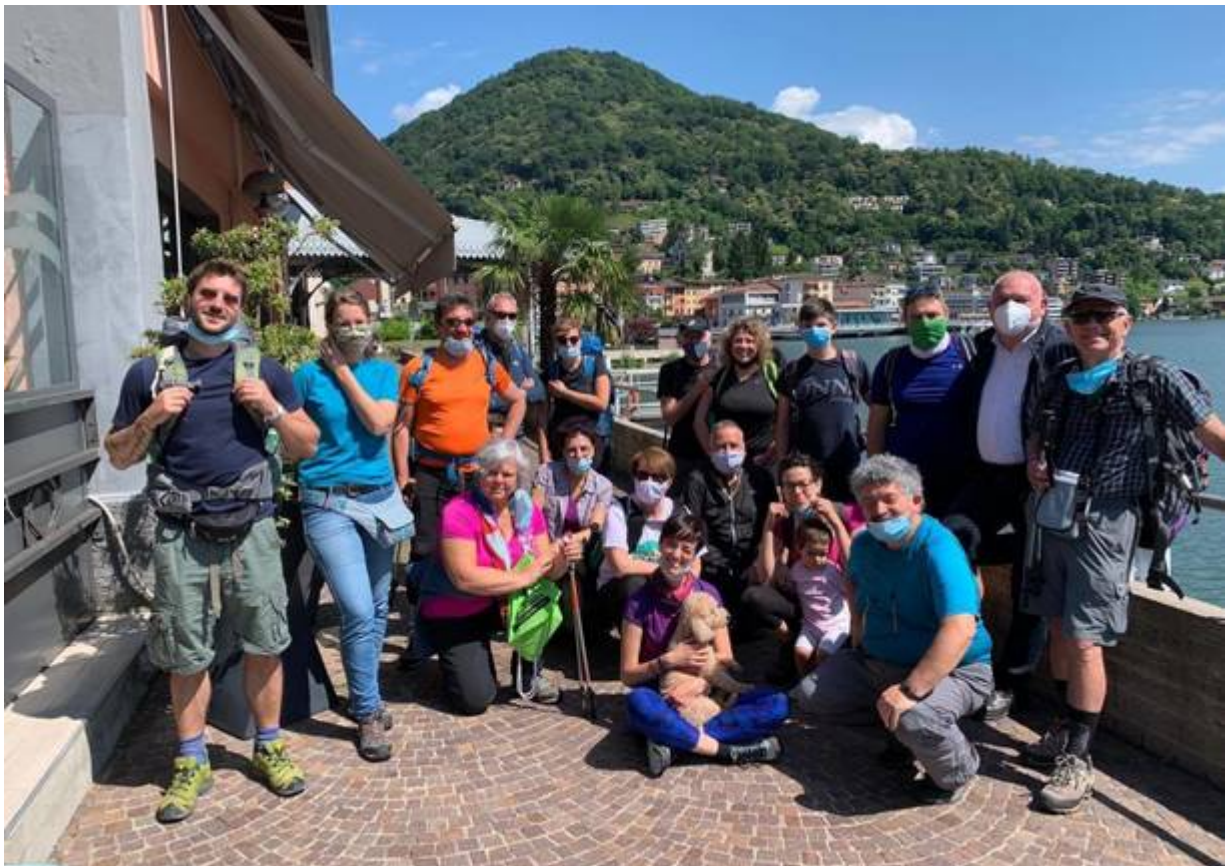
Pellegrini in partenza

Riparte la Via Francisca del Lucomagno e con lei anche l'economia locale fatta di una rete di accoglienze che si trova lungo tutto il percorso. Merito delle progressive riaperture, ma anche dell'avvicinarsi della bella stagione, nel solo mese di maggio sono stati oltre 200 i pellegrini che si sono incamminati lungo i 135 km che uniscono il suggestivo lago Ceresio, che si trova al confine con la Svizzera, con la città di Pavia , o meglio la basilica di San Pietro in Ciel d'Oro, sostando per oltre 1.000 notti nelle strutture di accoglienza.