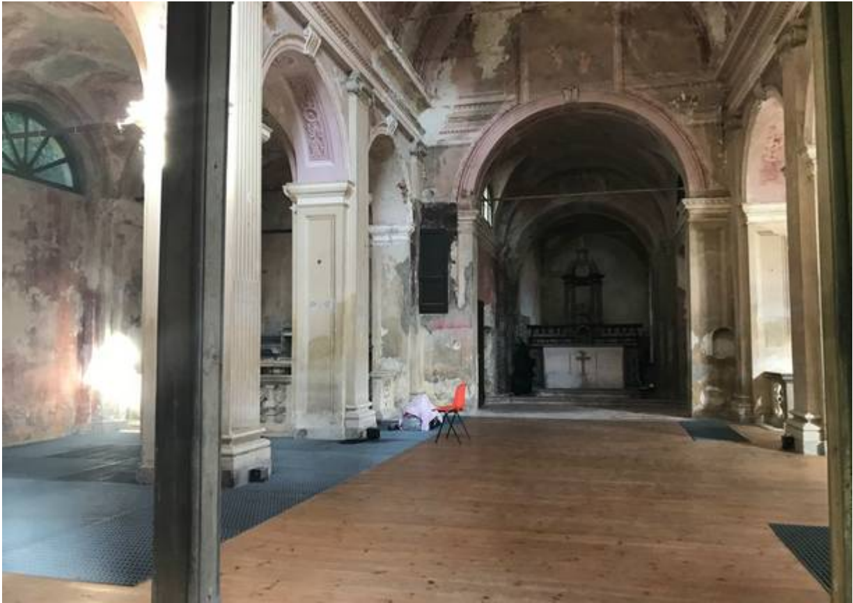
San Giovanni a Casciago

Altri Comuni hanno scelto di provare a intercettare i fondi non per avviare interventi su patrimonio oggi inutilizzato, ma per rimettere mano a ciò che già c'è: valga l'esempio di Cardano al Campo , che vorrebbe usare i fondi per ammodernare il municipio. Stesso investimento farà anche Samarate , con l'obiettivo di arrivare ad ampliare il municipio e "liberare" altri spazi (un'altra sede comunale – oggi usata come ufficio tecnico – tornerebbe utilizzabile come sala pubblica).