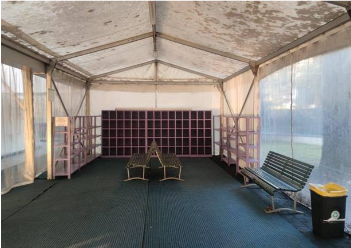
FOTO: LA STRUTTURA ESTERNA DELLA PISTA DI PATTINAGGIO CHE SARA' MESSA DISPOSIZIONE DEL PROGETTO