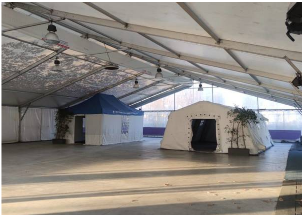
FOTO: LE TENDE DI CROCE ROSSA E PROTEZIONE CIVILE